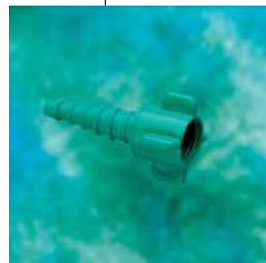
Adaptador Nipple (2555)