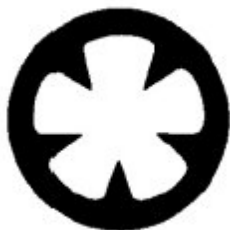
Desenho esquemático do Tubo Star Lúmen

Tubo de suprimento verde Conector Padrão